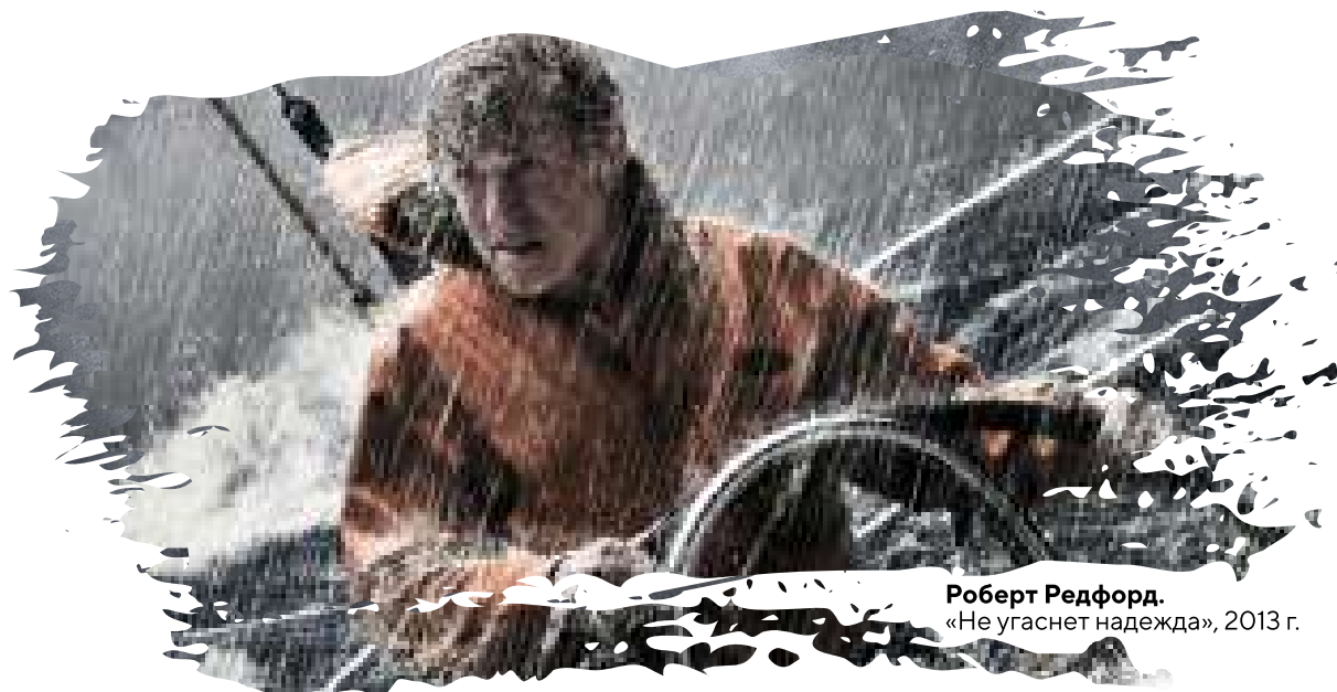
Роберт Редфорд. «Не угаснет надежда», 2013 г.

Подписанный президентом закон дает мобилизованным индивидуальным предпринимателям и юридическим лицам право передать свой бизнес в доверительное управление .