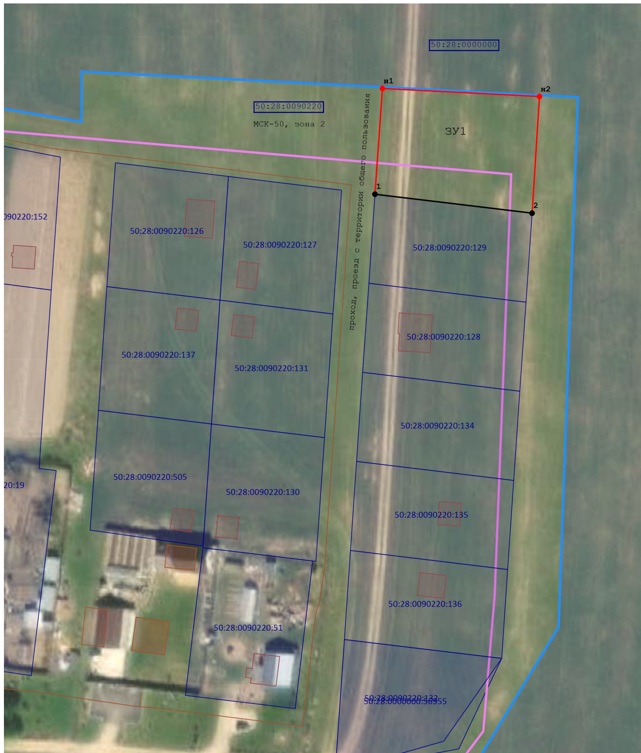
Масштаб 1:1 000