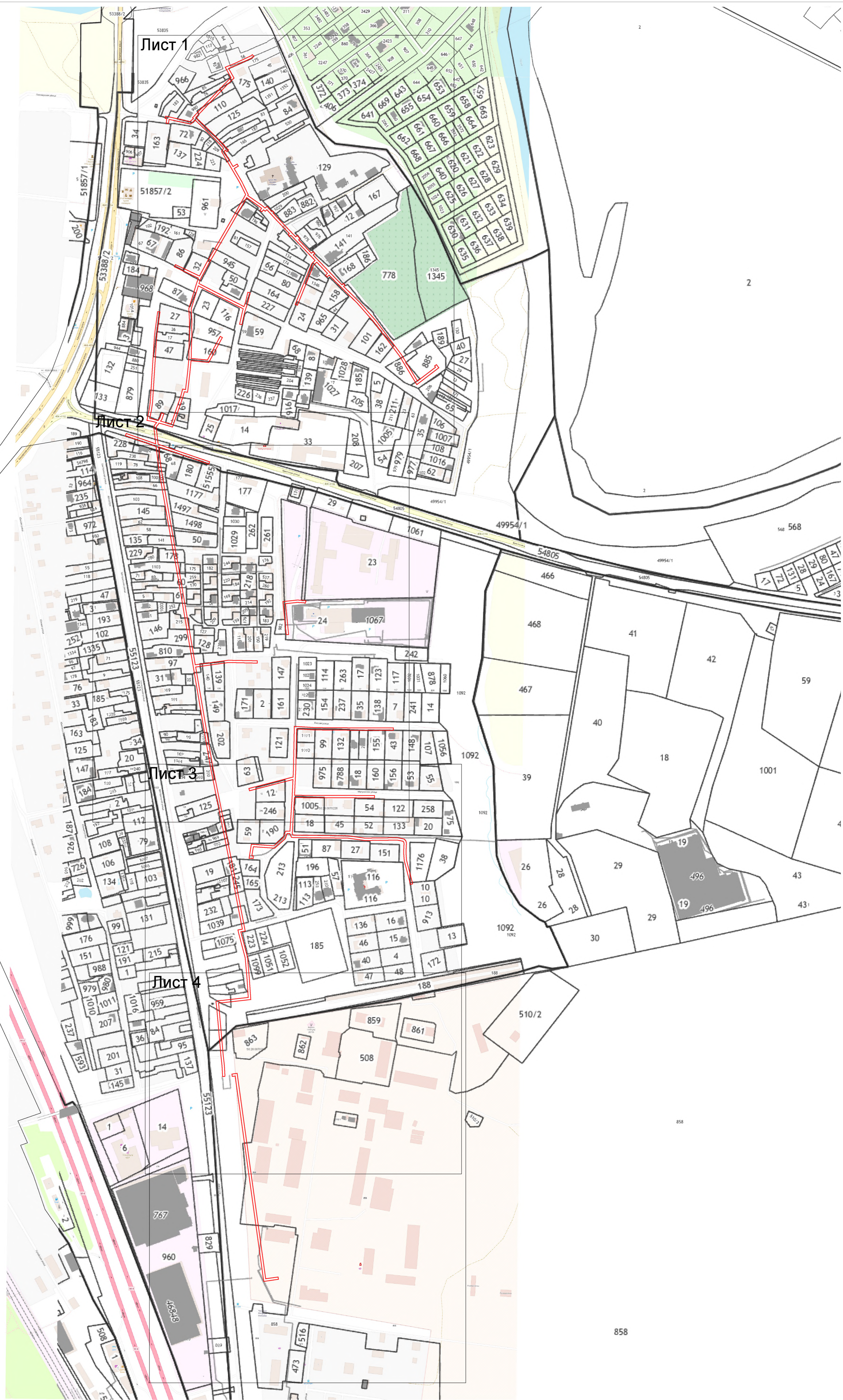
Масштаб 1:3 400